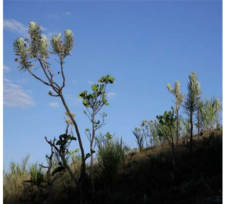
Bioma ocupa 25% do território nacional e está presente em 11 estados

De acordo com estudo realizado pela Mapbiomas, o Cerrado perdeu 27% de sua vegetação nativa nos últimos 39 anos, o que representa 38 milhões de hectares