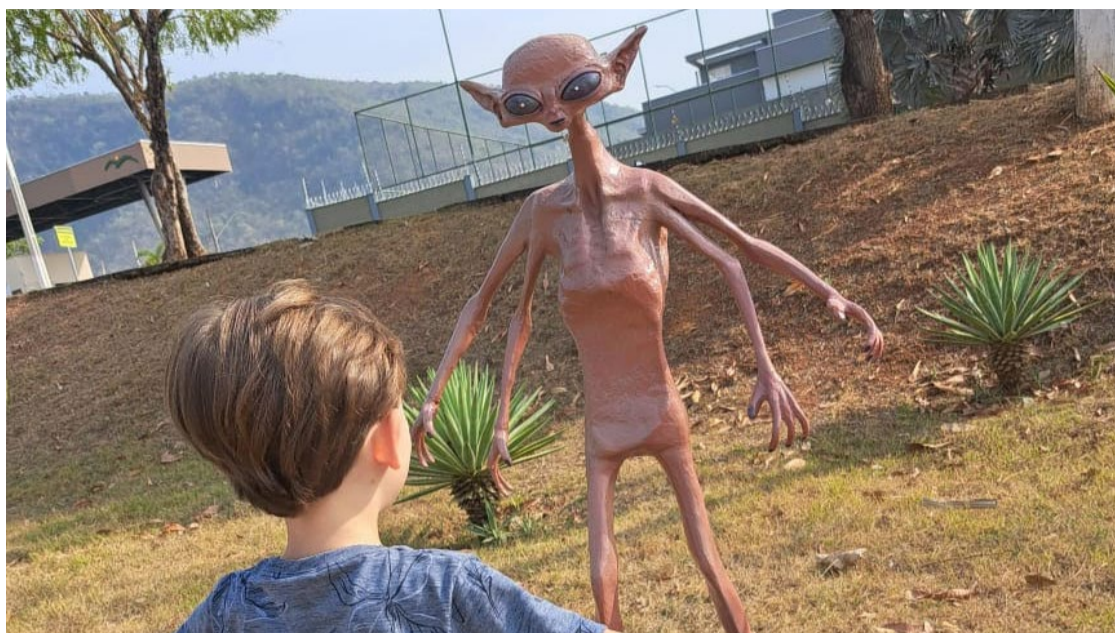
Incentivo ao turismo ufológico na cidade está previsto em lei municipal que criou o Dia do ET

Em novembro de 2011, a Casa Branca divulgou resposta oficial a duas petições pedindo ao governo reconhecer formalmente que os extraterrestres têm visitado a Terra e divulgasse qualquer evidência de interação intencional do governo com seres extraterrestres. De acordo com a resposta: “O governo dos Estados Unidos não tem nenhuma evidência de que qualquer vida exista fora do nosso planeta, ou que uma presença extraterrestre tenha contactado ou engajado qualquer membro da raça humana”.