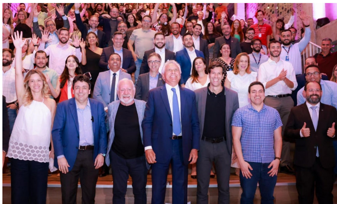
Governador Ronaldo Caiado e organizadores da Campus Party: desafio é tornar jovens goianos cada vez mais competitivos no mundo

Temática “Construindo uma geração tecnológica e de IA em Goiás” visa reunir e integrar especialistas e interessados em Inteligência Artificial. Governador Ronaldo Caiado afirma que momento é de inclusão sobre novas revoluções da tecnologia