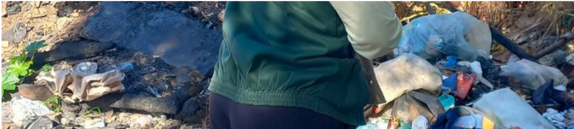
Agentes Comunitários de Saúde realizam ações contra mosquito Aedes aegypti , transmissor da dengue, zika e chikungunya

Neste ano, agentes comunitários de endemias visitaram 1,89 milhão de imóveis, em 3,2% foram encontrados focos do Aedes aegypti