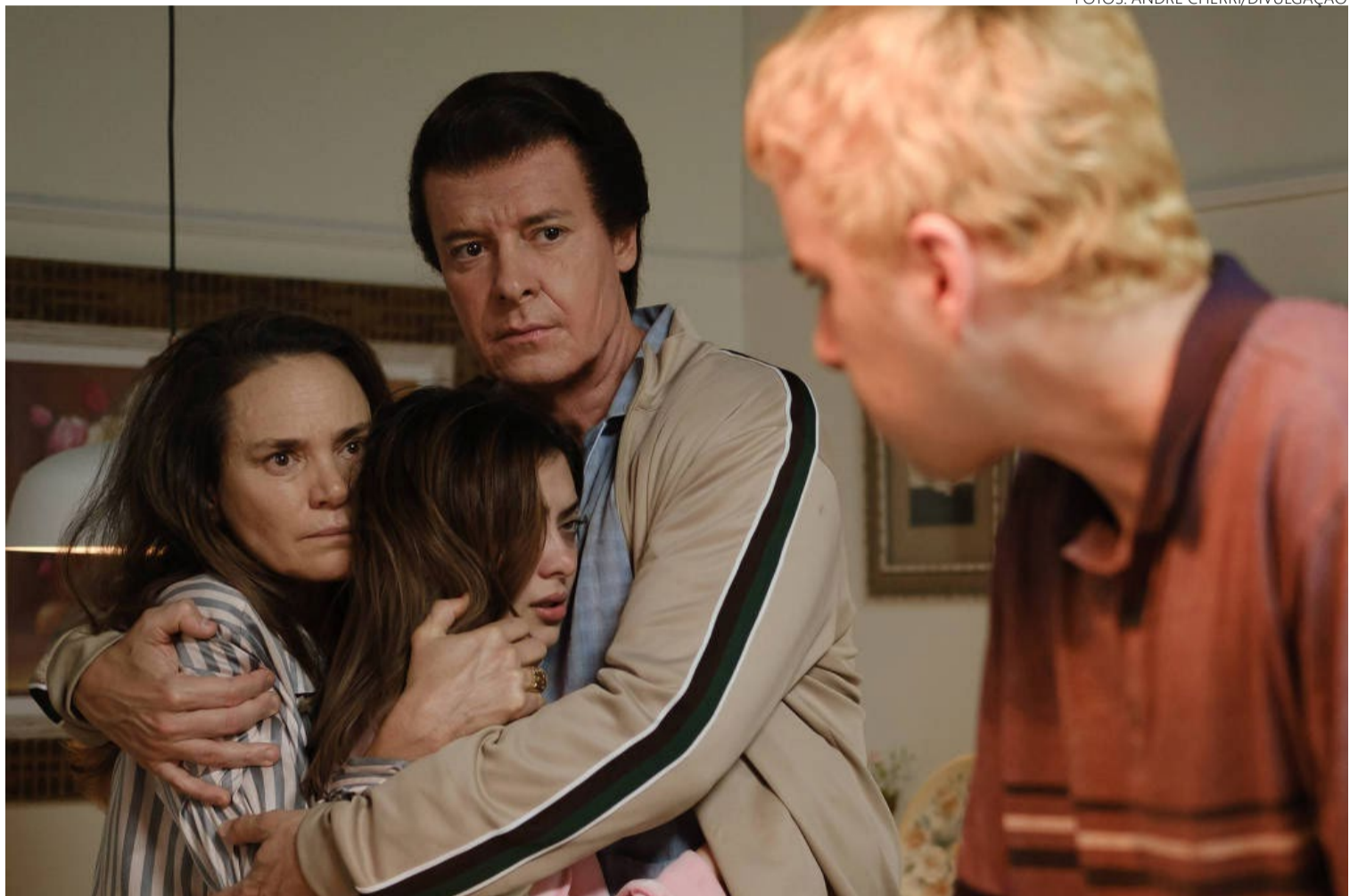
Período em que se desenvolve roteiro cobre quase oito horas que apresentador esteve sob mira de arma

E o que foi dito ali não tem mais como ser averiguado. Silvio Santos nunca deu detalhes do sequestro e morreu no último 17 de